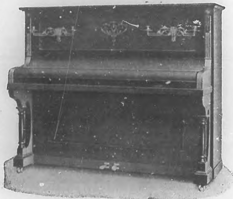
Piano "R. Gors & Kallmann", que "Bohemia" sortea entre sus abonados.

Con todo ello Bohemia Modes tendrá los mayores atractivos: y aun ellos son el inicio de otros que iremos acumulando sucesivamente, siempre en beneficio de nuestros favorecedores.