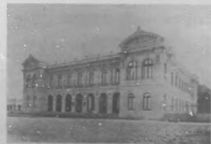
Escuela de Medicina de Lima en donde se reunió la comisión por primera vez para organizar el "Centro Universitario".