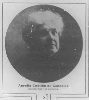
Aurelia Castillo de González Ilustre poetisa cubana.

Y, así, tranquila y satisfecha de su obra, orgullosa de su bien, la noble señora, puede aceptar sin sonrojarse, todas las frases que en su alabanza, digan, Terros de gratitud: los labios que besan con inocencia; sientan, llenos de amor, los corazones que quieren con sinceridad, y piensan, llenos de ilusión, todas las rubias cabeceas infantiles, que deben ornar con el oro de sus rizos, los poéticos ensueños de la gentil escritora.