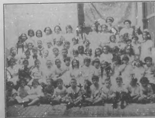
Colegio "San José".—Grupo de alumnas de ambos sexos.

Colegios como éste, á cuyo frente se encuentran perso-