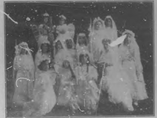
Colegio "San José".—Grupo de niñas que tomaron la primera comunión.

nas de tan reconocida competencia, son las que deben tener presentes los padres de familia al elegir el centro educativo de sus hijos.