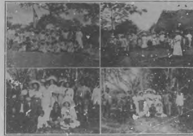
Excursión Escolar de Bayamo al Chino.—Diversos aspectos de la misma.